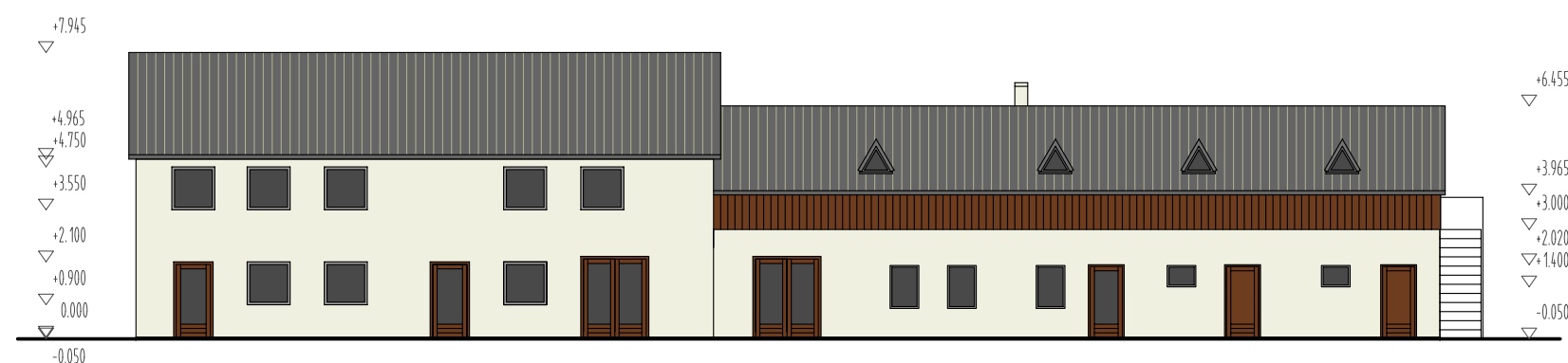
FASÁDA JIHOVÝCHODNÍ HOSPODÁŘSKÉ BUDOVY